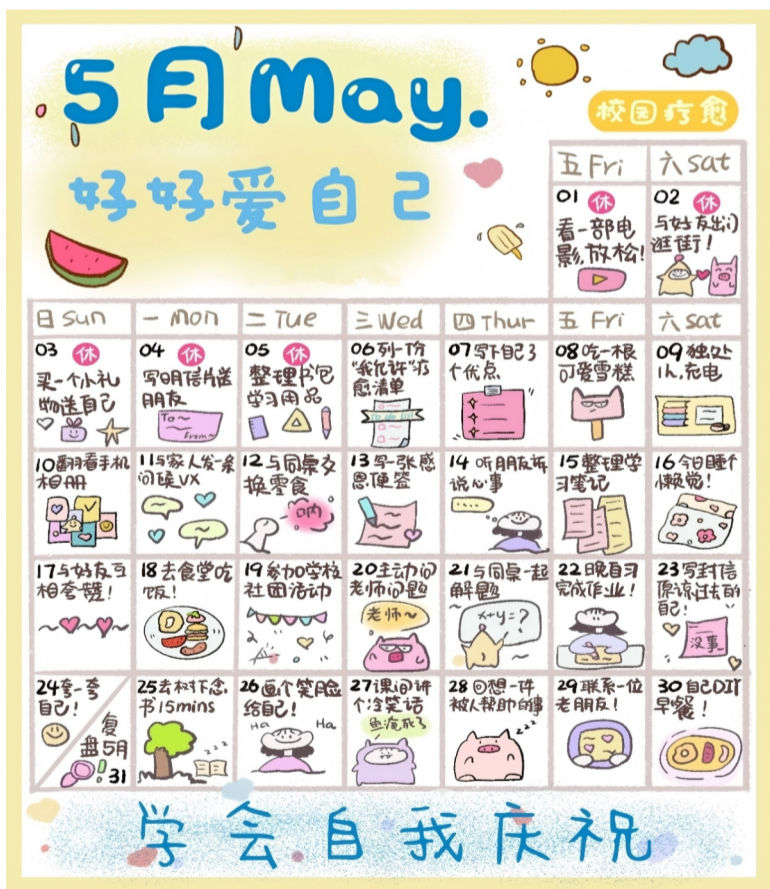
2026年5月自我关怀日历 (tips: 预设任务不合心意随时可以替换成你喜欢的内容，你的感受最重要~)

小叮囑：你不需要逼自己必须完成所有任务，哪怕这个月只做到了5件，也是超棒的收获。自我关怀从来不是“浪费时间”，当你愿意好好对待自己的时候，你会发现：你本身就足够好，值得所有的夸奖和开心。如果某天你突然觉得情绪低落、压力很大，就停下来翻一翻这份日历，做一件最简单的小事——你永远可以先照顾好自己，再去奔赴想要的未来呀。